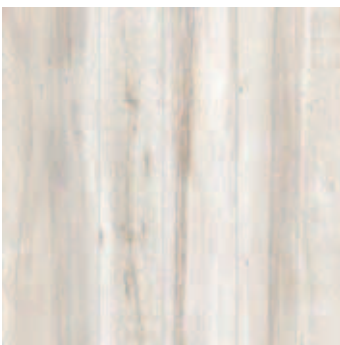
DETAILS WHITE GRIP 20mm 744317 60x60 (23 5/8 ”x23 5/8 ”)