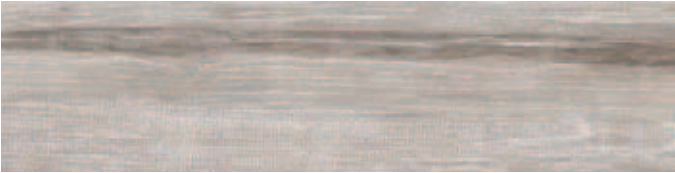
DETAILS GRAY 743729 30x120 (11 4/5 x 47 1/4 )