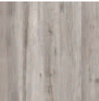
DETAILS GRAY GRIP 20mm 744318 60x60 (23 5/8 x 23 5/8 )