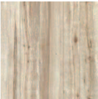
DETAILS BEIGE GRIP 20mm 744319 60x60 (23 5/8 "x23 5/8 ")