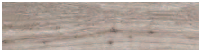
DETAILS TAUPE 743732 30x120 (11 4/8 "x47 1/4 "