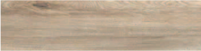
DETAILS BEIGE 743730 30x120 (11 45/64 "x47 1/4 ")