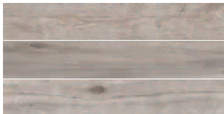
DETAILS GRAY GRIP 20mm 744321 40x80 (15 3/4 x 31 1/2 )