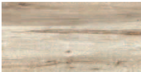
DETAILS BEIGE GRIP 20mm 744322 40x80 (15 3/4 "x31 1/2 ")