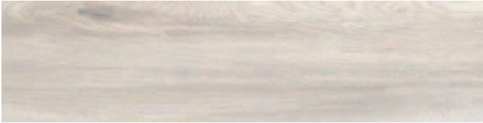
DETAILS WHITE 743728 30x120 (11 48 ”x47 1/4 ”)