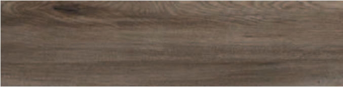
DETAILS BROWN 743731 30x120 (11 4/8 "x47 1/4 "